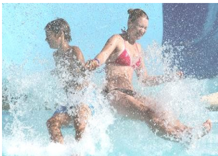
Budapest Resort - Aquaworld