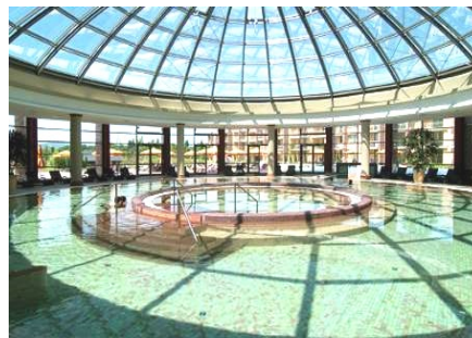
Budapest Resort Oriental Spa

Budimpešta je idealan primer kako na svom mini wellness odmoru možete uživati u znamenitostima Budima i Pešte, probati čuvene mađarske specijalitete i poslastice, ali i aktivno uživati u sadržajima wellnessa i akva parka u bilo koje doba godine. Budapest Resort je luksuzni klimatizovani hotelski kompleks sa jednim od najvećih zatvorenih vodenih parkova u Evropi. Od Beograda je udaljen 379 km